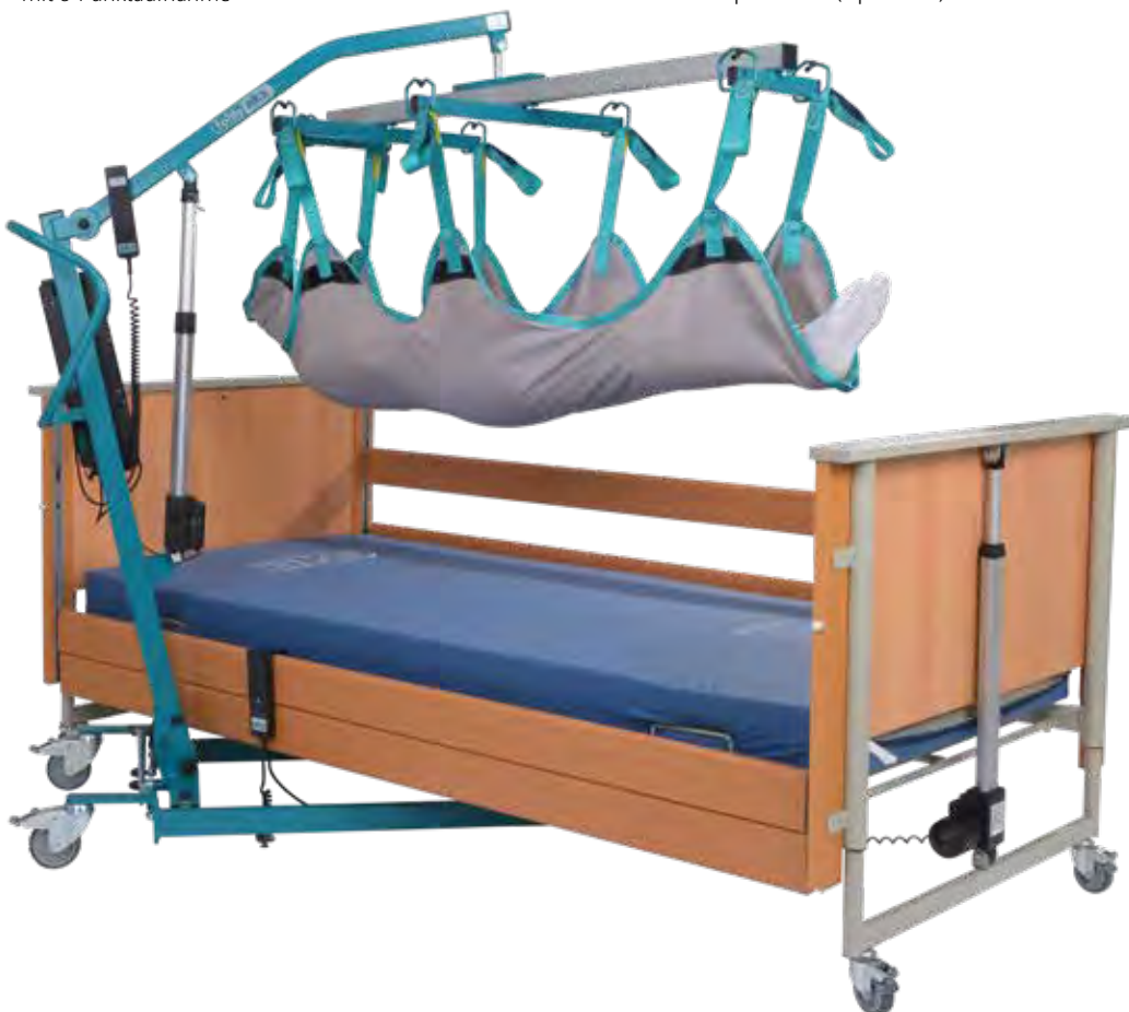
aks-Liegendtransportgurt für Transportbügel mit 8-Punktaufnahme