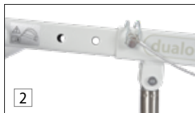
Hebearm XL aktiv smart