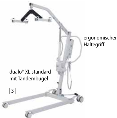
dualo® XL standard mit Tandembügel