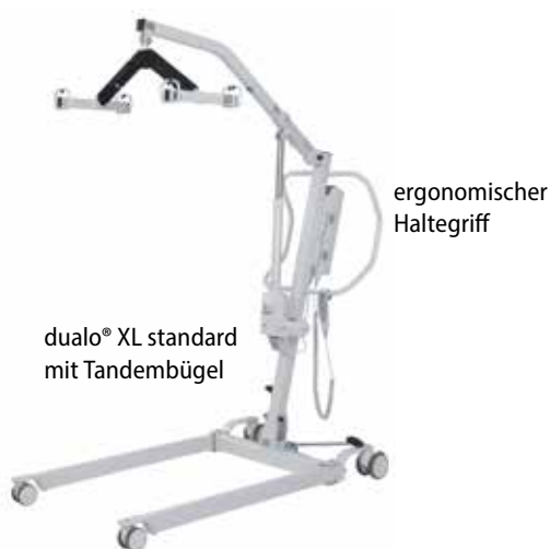
dualo® XL standard mit Tandembügel