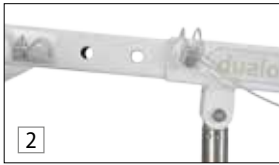
dualo® XL aktiv mit Hebearm aktiv smart