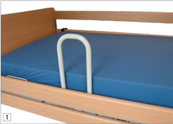
1 aks-Aufstehhilfe für Pflegebetten, hier am aks-S4 montiert